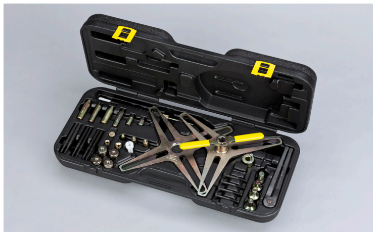
Εικόνα 1: Το ειδικό εργαλείο 400 0237 10 για την εγκατάσταση του συμπλέκτη