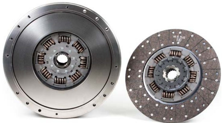
Εικόνα 2: Διπλός συμπλέκτης LuK με ίδια κέντρα

Οι διπλοί συμπλέκτες άλλων προμηθευτών (Εικ. 3), είναι πιθανόν να φέρουν στο δίσκο τους μια επιμήκυνση του κέντρου τους. Σε αυτή τη περίπτωση η δύναμη του δεύτερου συμπλέκτη, δεν μεταφέρεται από το κέντρο του προς τον πρωτεύοντα, αλλά από την εσωτερική οδόντωση του πρώτου συμπλέκτη.