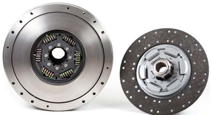
Εικόνα 3: Παράδειγμα διπλού συμπλέκτη, με διαφοροποιημένο σχεδιασμό του κέντρου του