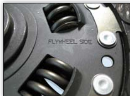
Εικόνα 1-4: Πιθανές επιγραφές στο δίσκο του συμπλέκτη

Εάν δεν υπάρχει καμία επιγραφή, τοποθετείται όπως ο προηγούμενος δίσκος συμπλέκτη. Βάσει αυτής της επισήμανσης μπορεί να καθοριστεί η θέση τοποθέτησης του νέου δίσκου συμπλέκτη.