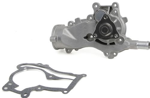
Εικόνα 1: 538 0314 10 – Η αντλία νερού με την φλάντζα που τη συνοδεύει

Η αντλία νερού 538 0314 10 στεγανοποιείται με φλάντζα. ΔΕΝ πρέπει να εφαρμόζεται κόλλα στεγανοποίησης κατά τη τοποθέτηση.