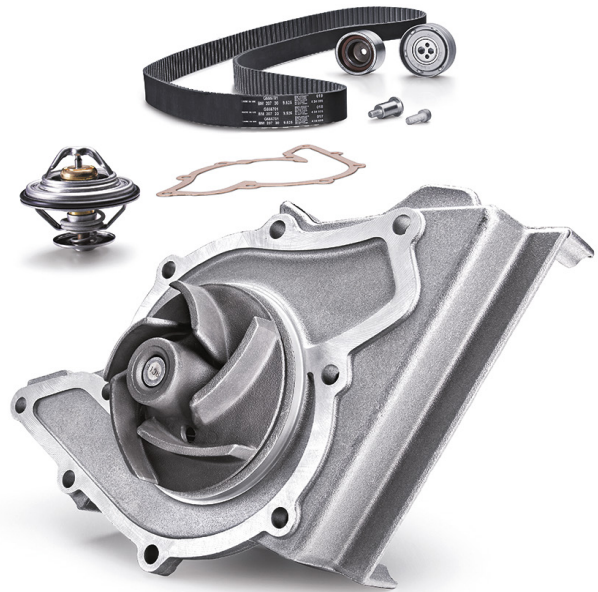
Εικόνα 2: ΚΙΤ αντλίας νερού με χάρτινη φλάντζα

Πριν τη τοποθέτηση μιας καινούργιας αντλίας νερού, χρησιμοποιήστε μια ξύστρα ή ένα μαλακό σφουγγαράκι καθαρισμού, για να προετοιμάσετε και να καθαρίσετε τις επιφάνειες στεγανοποίησης.