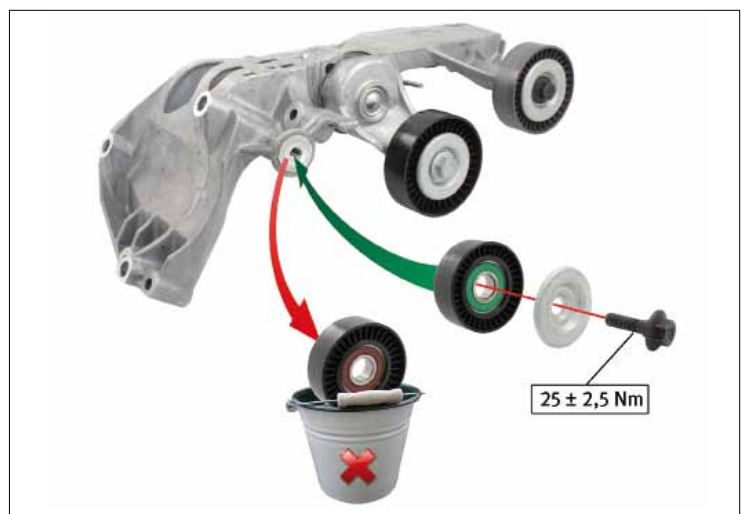
Εικόνα 1: μονάδα τάνυσης 534 0243 10

Η μονάδα τεντωτήρα είναι εξοπλισμένη αρχικά με τροχαλίες παρέκκλισης που είναι κατάλληλες μόνο για κινητήρες βενζίνης.